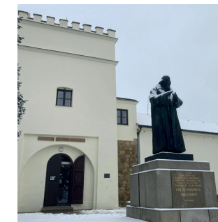
Muzeum Jana Amose Komenského