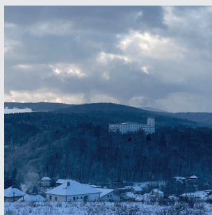
zámek Nový Světlov