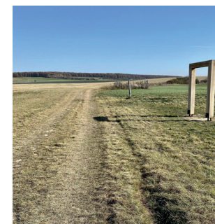
Havřícká naučná stezka

Pokračujte směrem k remízku Chrástka, který lze po červené naučné Havřícké stezce obejít, anebo do něj můžete vstoupit některou vyšlapanou cestičkou a na naučnou stezku se napojit posléze. Pokud jste ještě nenavštívili Muzeum Jana Amose Komenského, tak si jej tentokrát nenechte ujít! Na nádvoří budovy muzea se nachází milá muzejní kavárna, kde se můžete odměnit za ušlé kilometry.