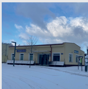
vlaková stanice Bojkovice